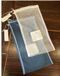
洗濯ネット(白・青)